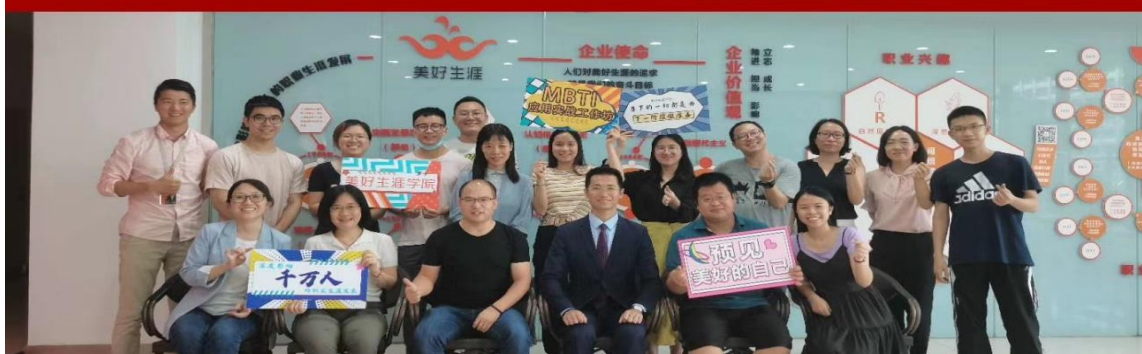
明旭老师受邀为业内生涯机构开展《MBTI 生涯测评实战技能提升培训》

明旭生涯赋能，专注 12 年，做有温度的咨询师，赋能行业发展，为 2 亿大学生和职场人幸福就业赋能！